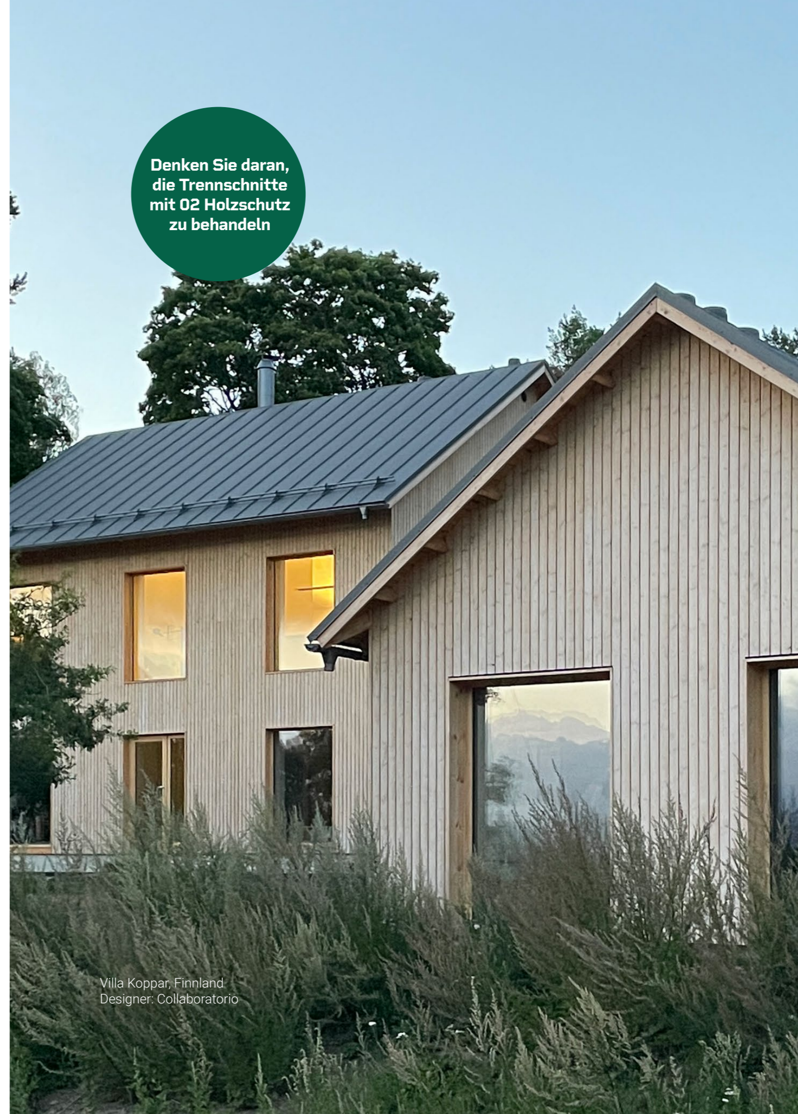
Villa Koppar, Finnland Designer: Collaboratorio

Denken Sie daran, die Trennschnitte mit 02 Holzschutz zu behandeln