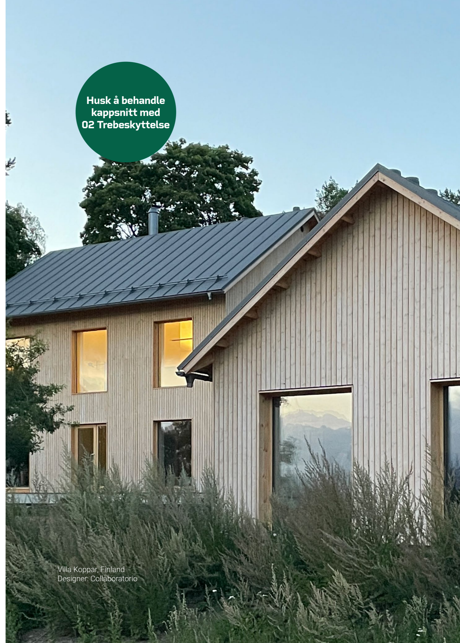
Villa Koppar, Finland Designer: Collaboratorio

Husk å behandle kappsnitt med O2 Trebeskyttelse