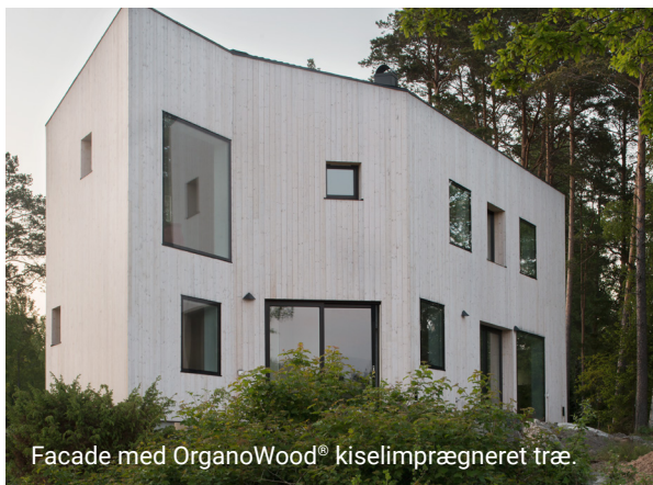
Facade med OrganoWood® kiselimprægneret træ.

01 Træbeskyttelse og Trærensning er mærket med Natur-skyddsforeningens Bra Miljöval. 01 Træbeskyttelse og 02 Overfladebeskyttelse er opført i Svanens portal for husprodukter og kan bruges i svanemærkede bygninger. Alle produkter har miljøklasse B hos SundaHus og anbefales af Byggarvbedömningen samt BASTA.