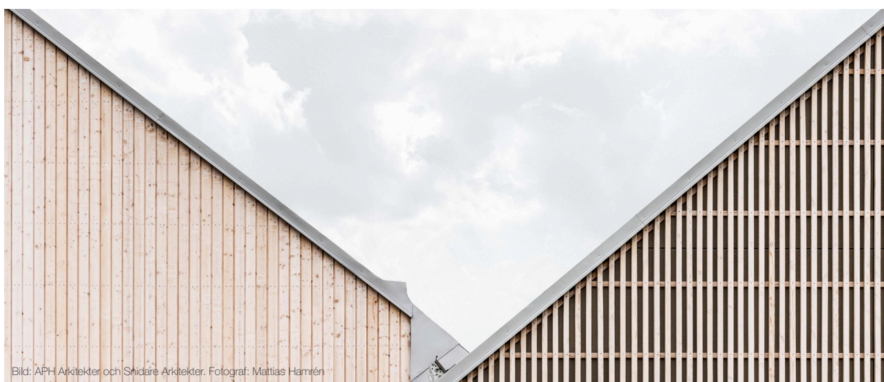
Bild: APH Arkitekter och Snidare Arkitekter.

Fönster i fasad med OrganoWood® Plus panelvirke ska monteras med överbleck för att skydda glaset mot eventuell överskott av OrganoWood 02.