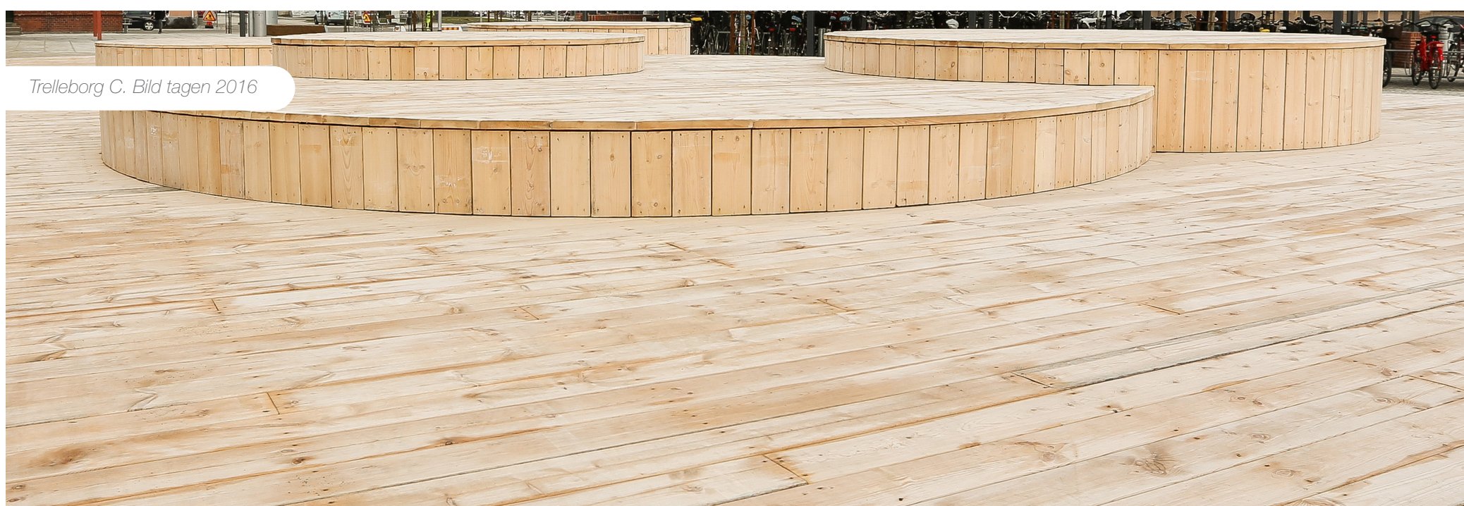
Trelleborg C. Bild tagen 2016

Virke som placeras utomhus blir grått naturligt men grånadsprocessen kan se olika ut under årstiderna och beroende på väderförhållanden. I vissa fall kan grånaden till en början upplevas som fläckig eller som mörka prickar/fält, men detta jämnas ut relativt snabbt. Redan efter ca 1 år har ett OrganoWood®s virke som placerats utomhus i direkt solljus fått en grå nyans. För skugglägen kan det ta längre tid och trä som aldrig blir exponerat för solljus, som till exempel undersidan på en trall, kommer inte att gråna på samma sätt. Trä monterat horisontellt har ofta en snabbare grånadsprocess än trä monterat vertikalt.