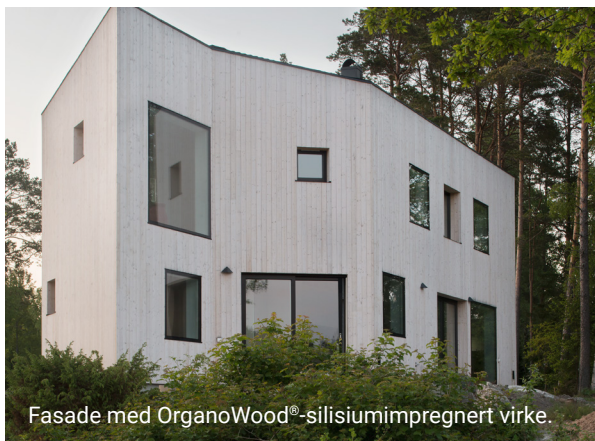
Fasade med OrganoWood®-silisiumimpregnert virke.

01 Trebeskyttelse og Tre rengjøring er merket med den svenske Naturskyddsföreningens «Bra Miljöval». 01 Trebeskyttelse og 02 Overflatebeskyttelse er oppført i Svanemerkets husproduktportal og kan brukes i svanemerke byggeprosjekter. Alle produktene har miljøklasse B hos SundaHus og anbefales av både Byggarubedömningen i Sverige og BASTA.