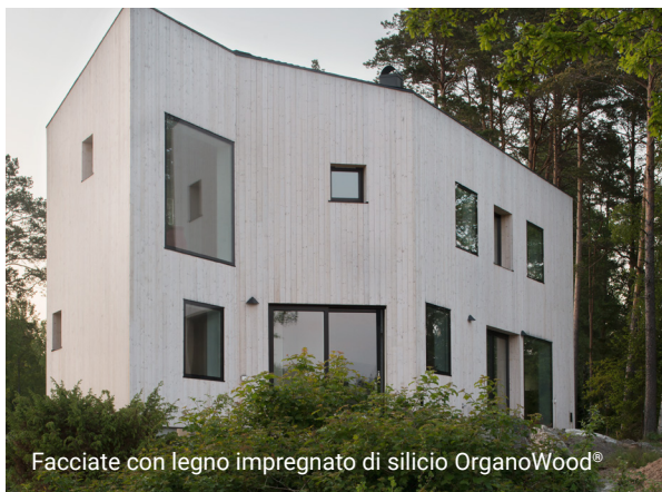
Facciate con legno impregnato di silicio OrganoWood®

01 Trattamento protettivo e Detergente per legno sono etichettati con il marchio ecologico Good Environmental Choice dell'Ente Svedese per la Conservazione della Natura. 01 Trattamento protettivo e 02 Protezione superficiale sono elencati nella lista del Portale per i prodotti ecologici per edifici "Swan" e può essere usato in edifici con marchio ecologico "Swan". Tutti i prodotti hanno ottenuto la classificazione ambientale B con SundaHus e sono raccomandati da Byggarubedömningen e BASTA.